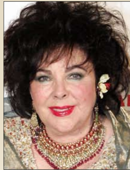
Elizabeth Taylor (27.02.1932) persönliches Element Erde, das gemeinsam mit einem sehr starken Wasser die Konstellation dominiert. Erst als das Metall im zeitlichen Aspekt zwischen Erde und Wasser „vermittelte“, konnte sie erfolgreich ihre Alkohol- und Tablettenabhängigkeit überwinden

Getreu dem Motto „Hilf Dir selbst“ kann jeder Mensch mit seiner Lebensweise eine ganze Menge dazu beitragen, sich selbst und damit auch die Fünf Elemente in seiner Konstellation in Harmonie zu bringen.