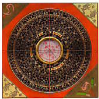
Der chinesische Kompass Loppa ist eines der wichtigsten Hilfsmittel der Feng Shui-Berater

Auch im modernen China werden Feng Shui-Erkenntnisse mit berücksichtigt, wenn es um die Errichtung kühner Neubauten geht. Hier die Bank of China in Hongkong