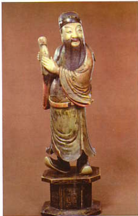
Bis vor kurzem wurde das Wissen über Feng Shui in China nur mündlich von Meister zu Schüler übermittelt

Stellen Sie sich vor, Sie stehen auf einem Hügel in der freien Natur und errichten dort eine Mauer. Mit dieser Mauer verändern Sie die Energie dieses Ortes. Sie können sich nun windgeschützt hinter die Mauer stellen oder die Mauer als Schattenspende nutzen. Je nachdem, wie also ein Gebäude in eine Landschaft gestellt wird, kann es unterstützend für den Menschen und die Umwelt wirken oder nicht. Deshalb ist es eben nicht egal, wo man sein Haus hinstellt oder in wel-