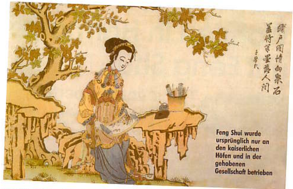
Feng Shui wurde ursprünglich nur an den kaiserlichen Höfen und in der gehobenen Gesellschaft betrieben