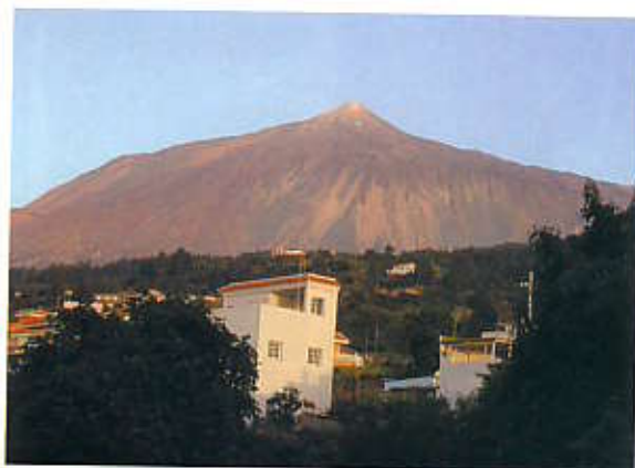
Nicht jedes Haus hat eine so mächtige „Schildkröte“ wie diesen schützenden Berg im Rücken

Unter Einbeziehung der Fünf Elemente Holz, Feuer, Erde, Metall und Wasser mit ihren bevorzugten Formen, Farben und Materialien kann man so manchem Ungleichgewicht auf die Spur kommen. Mit entsprechenden Feng Shui-Maßnahmen wie dem Einsatz von bestimmten Materialien lässt sich hier Abhilfe schaffen (siehe Tabelle links).