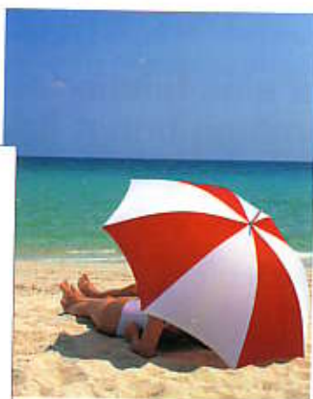
So wie am Strand ein kühler Wind Unbehagen verursacht, schaffen „Durchzüge“ ein ungünstiges Raumklima

Die Lehre von Yin und Yang und den Fünf Elementen spielt im klassischen Feng Shui eine große Rolle. Ursprünglich für die Schatten- und die Sonnenseite eines Berges verwendet, stehen Yin und Yang stellvertretend für alle Gegensätze unseres Lebens, die ohne einander nicht existieren können. In jedem Haus und jeder Wohnung gibt es aktive Bereiche wie Ess- oder Wohnzimmer (Yang) und passive wie Schlafzimmer oder Bad (Yin), die sich vorzugsweise in bestimmten Himmelsrichtungen befinden sollten.